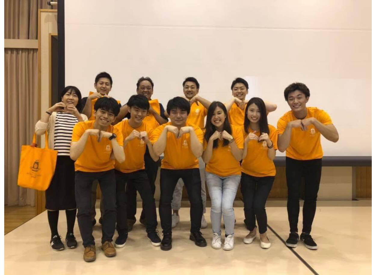
「八幡浜市で一週間のフィールドワークを行なった後 、マーマレードのMポーズ」